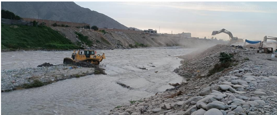
ZONA COLMATADA DEL RIO RIMAC